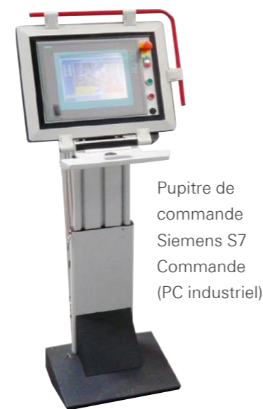
Pupitre de commande Siemens S7 Commande (PC industriel)