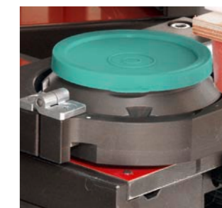
Cartouche d'encre MCI breveté (système d'encre fermé)