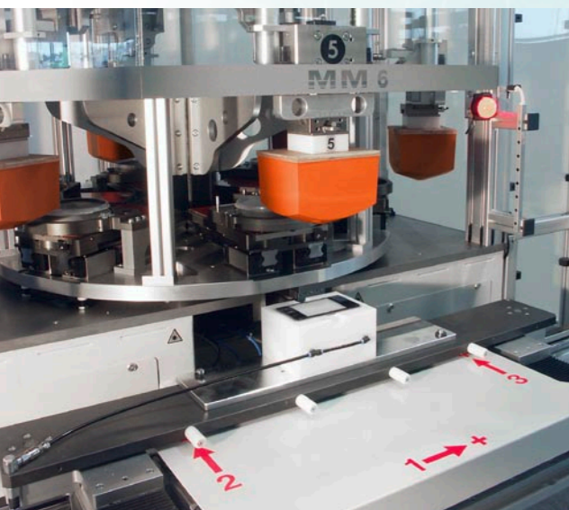
Image de gauche: la position de la pièce à usiner est corrigée par le biais des axes 1, 2 et 3. Une correction d'angle est en outre réalisée grâce à un déplacement opposé des axes 2 et 3.

Le système est également adapté pour l'impression de grandes pièces à usiner étant donné que différentes positions peuvent être déterminées.